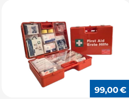
Erste Hilfe Koffer ÖNORM Z1020:2025