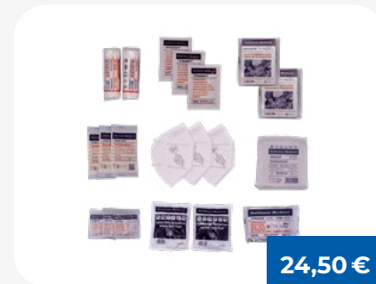
Ergänzungs-Set 2025 für ÖNORM Z 1020 Typ 2

Ergänzungs-Set Typ 1 - umfassende Nachfüllung für betriebliche Erste-Hilfe-Kästen gemäß aktueller Norm.