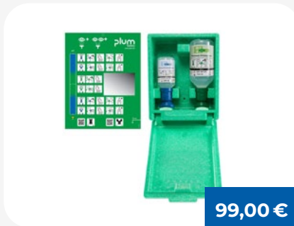
Plum Eyewash Boxes

Praktischer Salvequick® Pflasterspender für hygienische und einfache Entnahme von Pflastern, ideal für Arbeitsplätze und Erste-Hilfe-Stationen.