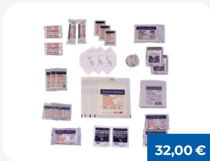
Ergänzungs-Set 2025 für ÖNORM Z 1020 Typ 1

Die Erste Hilfe Füllung umfasst ein 70-teiliges Sortiment für umfassende Erstversorgung.