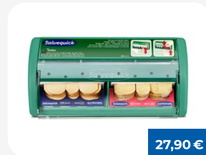
Salvequick® Pflasterstrips Pflasterspender

Ergänzungs-Set Typ 2 - umfassende Nachfüllung für betriebliche Erste-Hilfe-Kästen gemäß aktueller Norm.