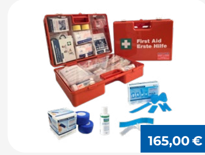
Erste Hilfe Koffer ÖNORM Z1020:2025 - Gastronomie

Der ideale Verbandkasten für Betriebe, mit kompletter Füllung und Wandhalterung.