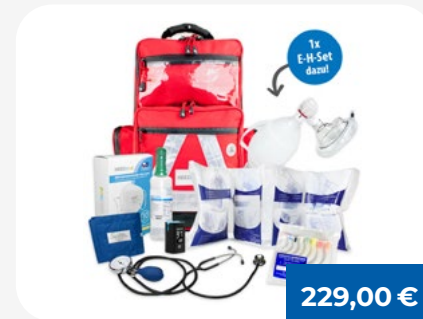
Notfallrucksack WaterStop PRO RED

Praktische Pflaster Box mit 200 elastischen Fingerverbänden in sortierten Größen.