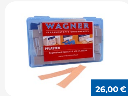
Pflaster Box Fingerverbände sortiert

Robuste Wandbox für Augenspüllösungen, ideal für die schnelle Erstversorgung bei Augenverletzungen.