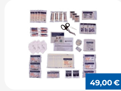
Erste Hilfe Nachfüllung ÖNORM Z 1020:2025

Erste-Hilfe-Koffer, ideal für Gastronomiebetriebe. Komplet bestückt mit speziellem blauem Pflastersortiment und Wandhalterung.